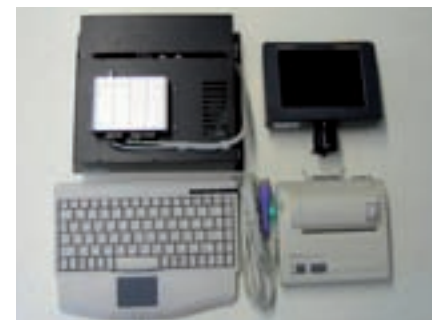
Bordcomputer, Monitor, Tastatur, Drucker